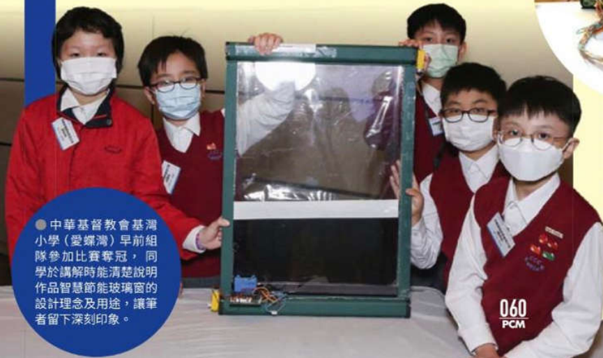
● 中華基督教會基灣小學（愛蝶灣）早前組隊參加比賽奪冠，同學於講解時能清楚說明作品智慧節能玻璃窗的設計理念及用途，讓筆者留下深刻印象。