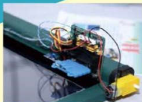
● 智慧節能玻璃窗設計概念簡單，而有評判指出獲獎重點正是小改變大改善，而且低成本高效能，只要加入感光器再驅動窗簾就達到環保減熱省電的效用。

以STEM之名，近年為筆者的科技教育採訪生涯帶來不少驚喜，由最初接觸的學生幾乎是清一色的背誦式學習，至近年有學生能活用科技，並展示出自主學習帶來的倍升成果，而且效果愈見精彩。今次採訪的中華基督教會基灣小學（愛蝶灣）於《Solve for Tomorrow》比賽中取得小學組冠軍，而該校學生能清楚娓娓道來設計作品由來及細節，充份展現出其科技掌控能力、自信及興趣。