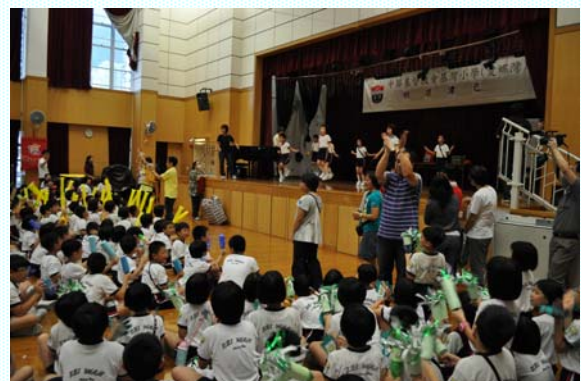
各社的「啦啦隊」落力地叫口號以助聲勢。