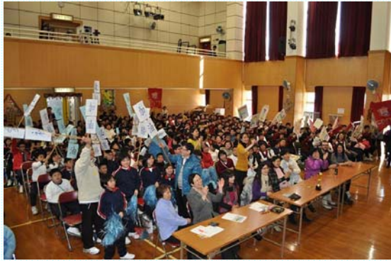
同學們在台下為各社的歌唱表演落力打氣。

另外，社際歌唱比賽亦於去年十二月十七日順利完成，比賽以社作單位，每社只可派一隊參賽。歌唱比賽前，為方便各社進行練習，學校特意於小息及午息時段開放音樂室予各社，並由音樂科的朱安麗老師及區穎兒老師作比賽顧問，提供音樂方面的意見。比賽當日則由劉惠明校長、蕭燕萍老師及崔穎瑜老師擔任評判，各社輪流表演，為角逐最積極參與獎、最具娛樂性獎及全場最佳表現獎而努力。比賽當天沒份兒參賽的社員，亦於該社演出前後為社員打氣，氣氛相當熱鬧。雖然初小的低年級同學未有參與社際，但於歌唱比賽當日，可以透過現場的直播，在課室內觀看比賽的過程，感受社際比賽的熱鬧氣氛，而社際歌唱比賽的得勝隊伍更於本學年的聖誕音樂會中作表演。