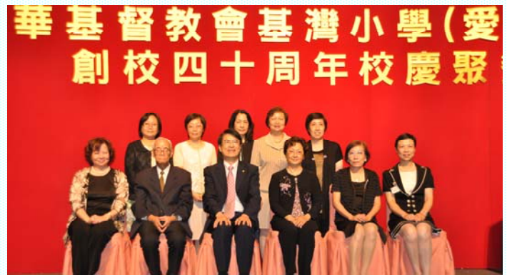
【歷任校長合照】(下排左至右)

這個晚上，真是令我畢生難忘。回想起女兒選小學時我的抉擇是正確的，我相當高興女兒能夠憑她的勞力考到 基灣小學 。本人在此再次多謝 基灣小學 的校長及老師們的偉大貢獻。