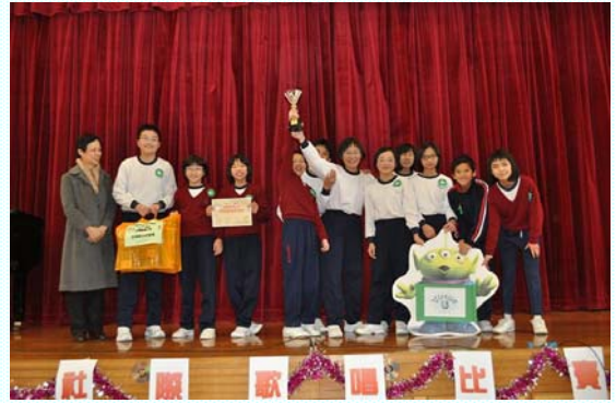
同學們都能為「社」爭取獎項而高興。

除了舉辦了的兩個活動之外，本學年將會舉辦的社際的活動還包括社際球類比賽（例如足球、籃球、乒乓球等等）及社際學科成績比賽，校方會根據四個社際比賽的成績，而選出全年社際大獎。校方更將會於本學期完結時，總結及檢討今次試行的成果、活動的內容及資源分配等，以助改善將來推行的模式。