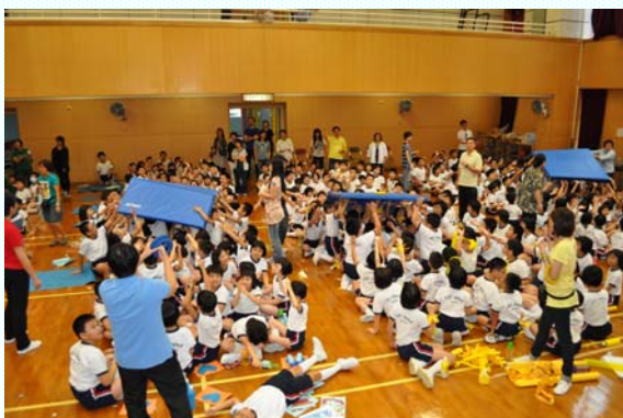
各社在運動會中為爭取好成績而使出混身解數。

第一個社際活動為本校的陸運會，雖然當天因天雨關係，舉行的地點由戶外改為本校的禮堂，但這也無損各同學的興致。各社員於陸運會舉行前，在小息及課餘時間，積極製作及預備比賽當日所需的打氣道具。於陸運會當日，除了各社參與比賽的同學努力競賽外，台下作「啦啦隊」的同學也十分落力叫口號，為自己的社員打氣，各同學對社的投入及當日的表現是各老師的意料之外。